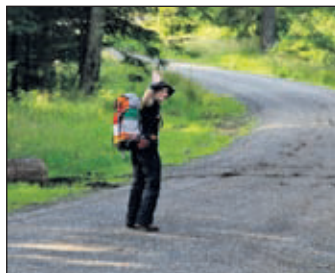
Weiter gehts ...

Es fehlen Nahrung, Wasser, Elektrizität. Die Kinder und ihre Familien brauchen jetzt besonders Hilfe für die medizinische Versorgung, für den Wiederaufbau ihrer Häuser und Hütten, neue Feuerstellen, neue Betten und das Allernötigste.